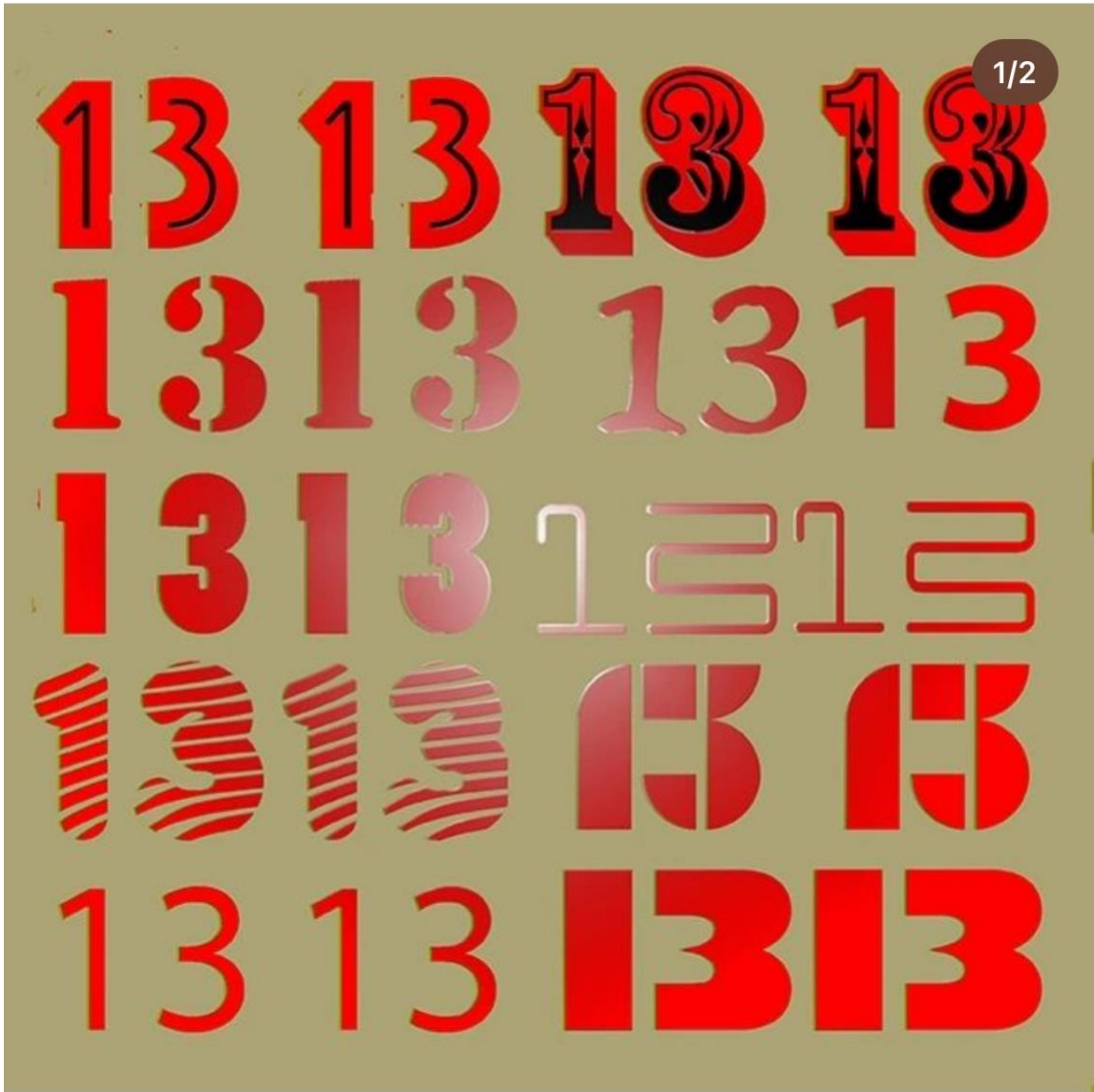
Augusto de Campos.